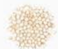
10004 W ホワイト(白)キヌア WHITE QUINOA