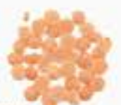
10112 赤レンズ豆(透明) RED LENTILS (SPLE)