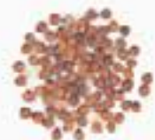
10008 R レッド(赤)キヌア RED QUINOA