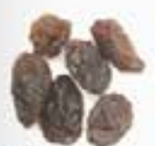
10146 干しインカベリー DRIED INCANCA BERRIES