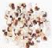
10043 Q キヌアプフ QUINOA PUFFS