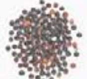
10012 B ブラック(黒)キヌア BLACK QUINOA