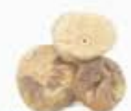
10144 干し無花果 DRIED FIGS