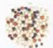
10185 M ミックスキヌア MIX QUINOA