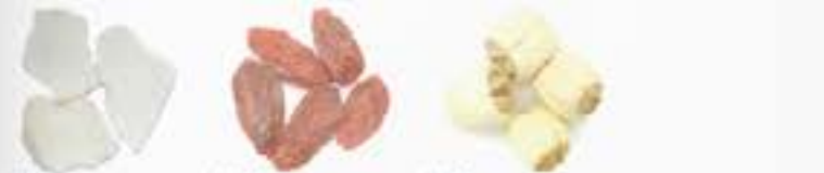
10153 C HINESE YAM 10156 G OJI BERRIES 10155 L OTUS ROOT