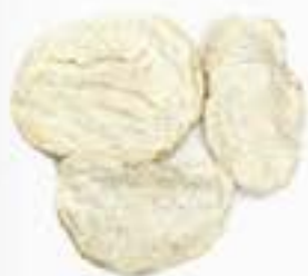
10041 M マカ薄片 MACA SLICE JUMBO