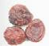
10142 ドライクランベリー DRIED CRANBERRIES