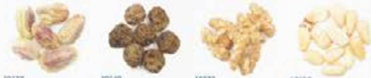
10138 P ISTACHIO 10140 T IGER NUT 10079 W ALNUT 10139 P INE NUT