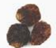
10149 干しインカベリー GOLDEN INCANCA BERRIES