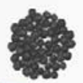
10115 黒レンズ豆 BLACK BEUGA LENTILS