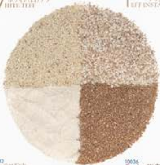
10032 T テフ粉本 TEFF FLOUR