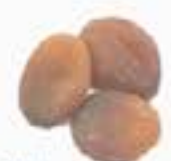
10143 干しあんず DRIED APRICOTS