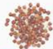
10096 R レッド(赤)キヌア RED QUINOA