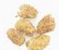
10148 干し枸杞 DRIED GOJI BERRIES