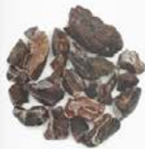
10098 C カカオ CACAO NIBS