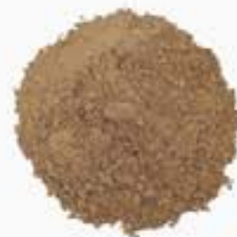
10042 C カカオ粉本 CACAO POWDER