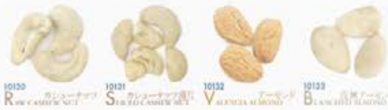
10120 R AW CASHEW NUT 10121 S TAR ED CASHEW NUT 10132 V ALENCIA ALMONDS 10133 B LANCH ALMONDS