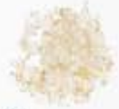
10063 Q キヌアフレーク QUINOA FLAKES