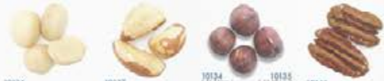
10126 R AW MACADAMIA NUT 10137 B RAZIL NUT 10134 R AW HAZELNUT KERNEL 10135 P ECANS