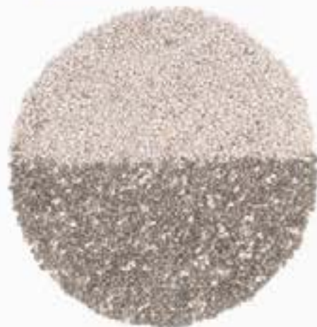
10024 B ブラック(黒)チアシード BLACK CHIA