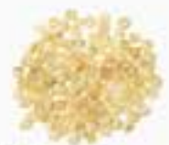
10061 P ペルー産キヌア PERUVIAN QUINOA