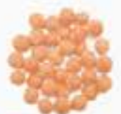
10111 赤レンズ豆 RED LENTILS