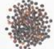
10097 B ブラック(黒)キヌア BLACK QUINOA