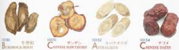
10150 B URDOCK ROOT 10151 C HINESE HAWTHORN 10152 A STRAGALUS 10154 C HINESE DATES