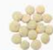
10113 緑レンズ豆 GREEN LENTILS