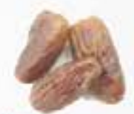
10145 干し枣 DRIED DATES