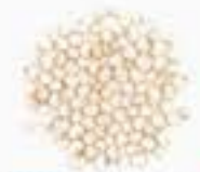
10095 W ホワイト(白)キヌア WHITE QUINOA