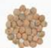
10114 茶レンズ豆 BROWN LENTILS