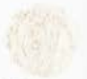
10189 Q キヌア粉 QUINOA FLOUR