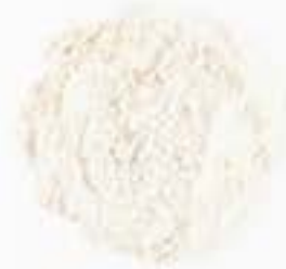
10040 M マカ粉本 MACA POWDER