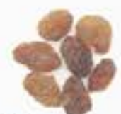
10147 干し枸杞 DRIED GOJI BERRIES