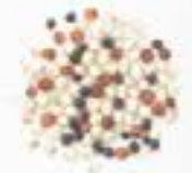
10016 M ミックスキヌア MIX QUINOA